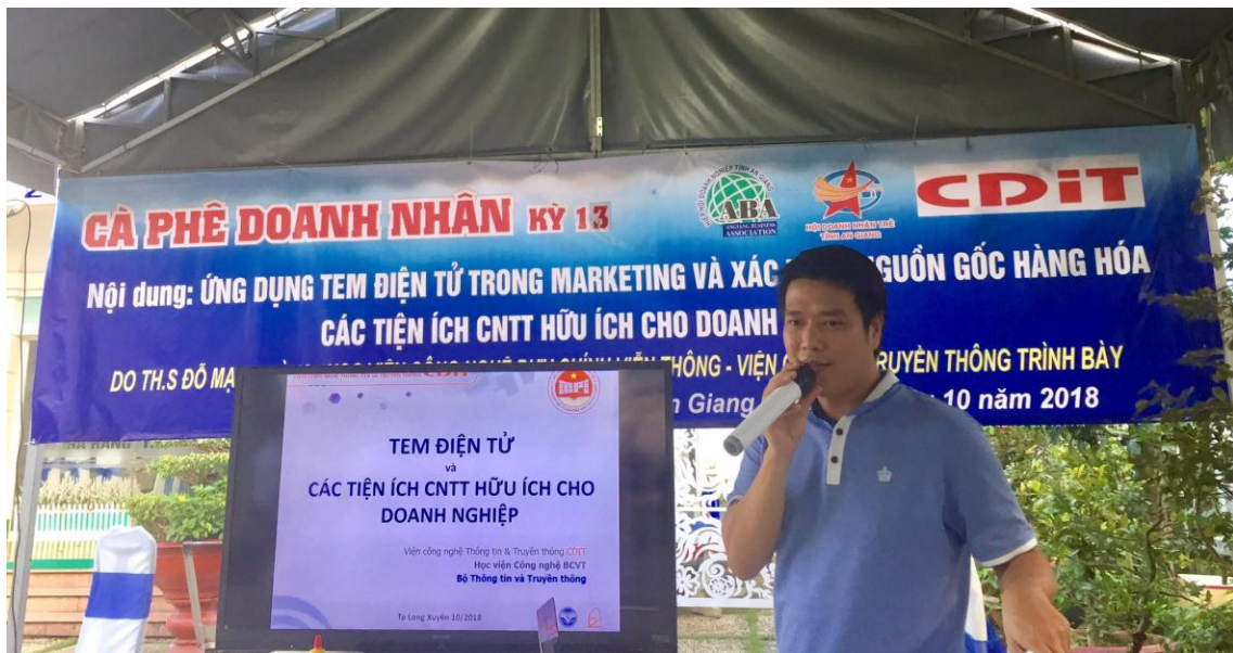
Hình 3: Đào tạo sử dụng tem điện tử trong marketing tại Cần Thơ, 10/2018

Khi tiến hành chương trình đào tạo, ngoài việc đào tạo các kiến thức về startup, khởi nghiệp; Viện CDIT còn phối hợp với các đối tác của mình (là các startup, các công ty) tạo cơ hội cho các học viên là các sinh viên được tham gia các dự án startup, làm thực tập sinh tại các doanh nghiệp để trực tiếp học hỏi và tích lũy kinh nghiệm thực tế khi tiến hành khởi nghiệp. Trong năm 2017, 100% các học viên được tạo điều kiện thăm quan thực tế tại các startup/doanh nghiệp; gần 20% số học viên được làm thực tập sinh tại các doanh nghiệp/startup; 10% học viên được các startup tiếp nhận vào làm việc.