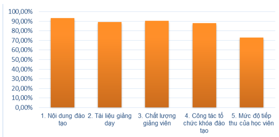
Bảng 2: Tổng hợp Kết quả khảo sát ý kiến học viên về chương trình đào tạo SME 2017, 2018

Với chương trình đào tạo Quản trị doanh nghiệp, Viện CDIT đã tổ chức hơn 100 lớp học cho trên 3000 lượt học viên đến từ hơn 40 DNNVV trên 18 tỉnh/thành phố khắp cả nước. Đánh giá về chất lượng đào tạo của Học viên đã tham dự khóa học ở mức Tốt đạt trên 85%.